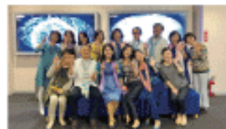
昨年開催された「プラネタリウムでシンギング・リンを楽しむ会」のスタッフの皆さんと!