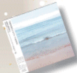
CD『サトリック・ブラクティス』。チェロの演奏を活性化させるチェロの原曲を、女神山ライフセンターで行われたインプロビゼーション・パフォーマンス7曲/43分収録(2000円+税)。