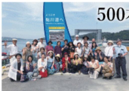
甚大な津波被害を受けながらも復興に向かう 鮎川港にて、参加者の皆さんと一緒に。