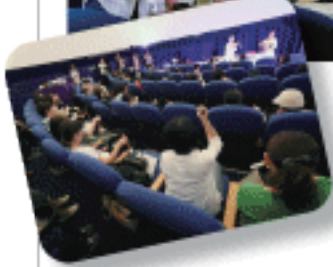
宇宙空間を浮遊するような音源や会場が一体となる会場などもお楽しみいただきました。

5回目を迎えた「プラネタリウムでシンギング・リンを楽しむ会」。 2019年9月21日(土)に 東京・築地のタイムドーム明石にて開催され、 沢山の方々にご参加くださいました。 その時の様子、そして2020年の開催概要をお届けします。