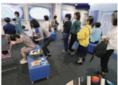
当日はお子様をはじめ、多くの方々がシンギング・リンの音響を体感されました。

次回は2020年6月27日(土)に開催予定。シンギング・リンの倍音の響きに包まれる体感を、より一層感じていただけるような楽しい趣向を計画中です。