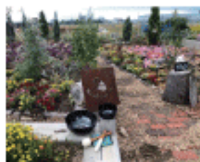
こころの森に500本の苗木を植樹 し、復興を祈念してシンギング・ リンを奏でました。

実際に足を運び、目で見て肌 で感じなければ、わからないこ とがたくさんあります。1人で も多くの方々との地を訪れて 支援を続け、これからも「忘れ ない」というメッセージを共有 していきたいと思っています。