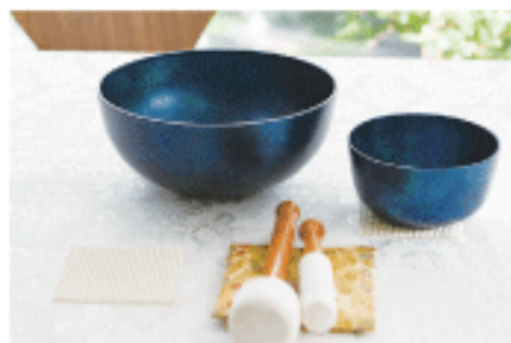
2019年10月に誕生したシンギング・リンの環境。光が当たる角度によって、青と緑の美しい色合いが浮かび上がる。それはさながら輝耀色の地球をあらわしているかのよう。詳細はP13にて。

寺山 いや、それは夢ではないと思います。以心明、お風呂の蒸気の中でリンを奏でたら、どんどん結合してつながり、しずくが天井から落ちてきましたから。