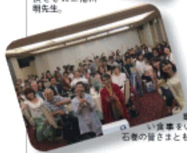
講演会ではおいし い食事をいただきながら、 石巻の皆さまとも交流しました。