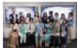
今年で4回目の開催となる「プラネタリウムでリンを奏でる会」のスタッフの皆さんと♪

活動内容 ▶ シンギング・リンの普及・啓蒙 ▶ シンギング・リンに関する各種技術、プログラムなどの研究・開発 ▶ シンギング・リンを使ったセラピストやプレイヤーの認定と登録 ▶ 公認セラピスト、公認プレイヤーの社会的地位の向上と職業としての確立を支援 ▶ シンギング・リンを通しての社会貢献活動の推進