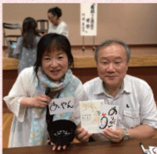
2018年7月「たいわ士」のイベントでご一緒した池川明先生とともに。